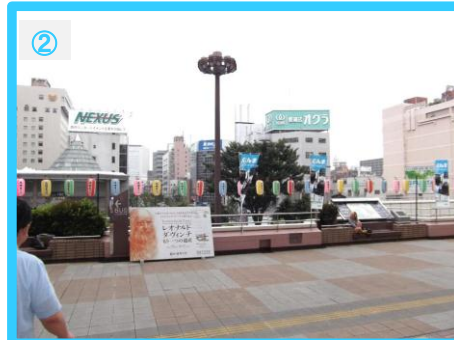
西口へ進みますとペデストリアンデッキがあります。デッキを右手方向へ進んでください。