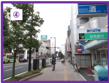
歩道をそのまま進んでいただきますと交差点になります。右角に朝鮮飯店、横断歩道を渡って直進してください。