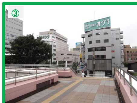
デッキなりに進んでいただき階段を下りてください。