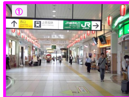
各改札口を出ますと東西への出口通路になります。西口へ進んでください。