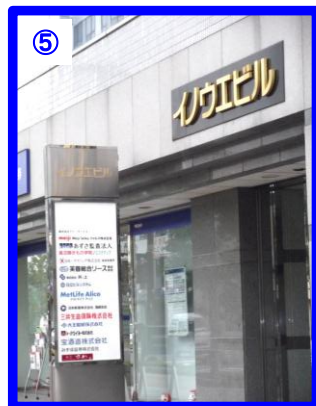
イノウエビル 高崎市八島町265番地